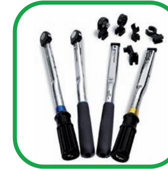
■ LLAVES DINAMOMÉTRICAS