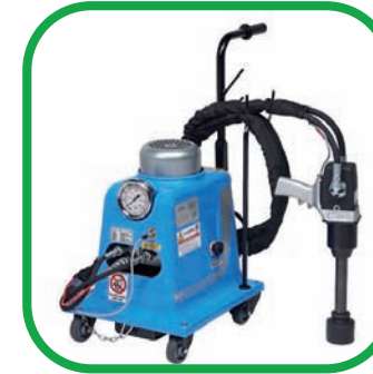
■ LLAVES DE IMPACTO HIDRÁULICAS Y NEUMÁTICAS