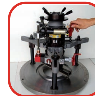
■ MECANIZADO PORTÁTIL