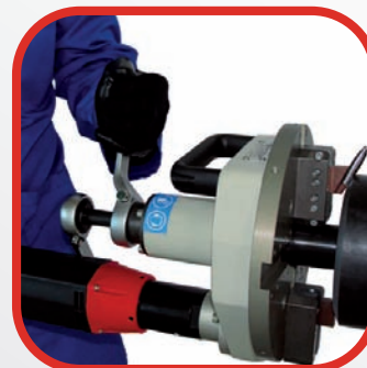
■ BISEL Y CORTE DE TUBERÍA