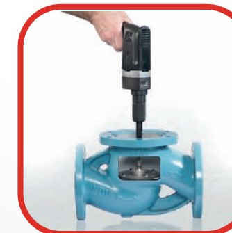
■ REPARACIÓN Y COMPROBACIÓN DE VÁLVULAS