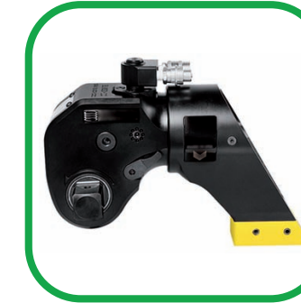
■ LLAVES DINAMOMÉTRICAS HIDRÁULICAS