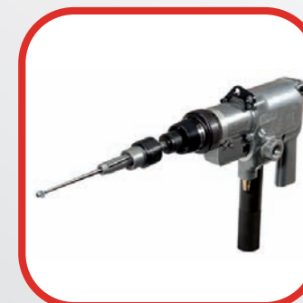
■ EXPANSIONADO DE TUBO