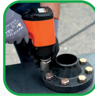
■ HERRAMIENTA NEUMÁTICA