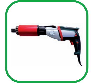
■ LLAVES ALTO PAR