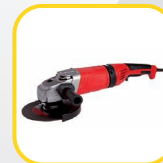
■ HERRAMIENTA ELÉCTRICA