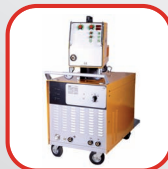
■ EQUIPOS DE SOLDADURA Y CORTE