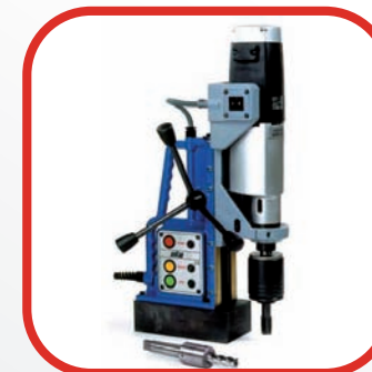
■ TALADROS DE BASE MAGNÉTICA