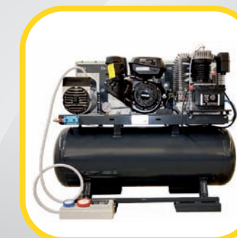
■ EQUIPOS MULTIENERGÍA